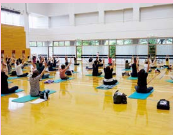
体験レッスン大盛況!