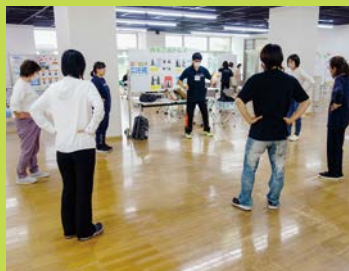
骨密度測定、体組成測定・ロコモ度測定会場は大盛況!