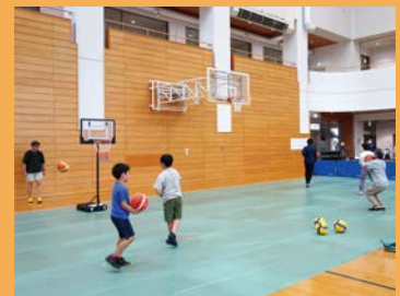
運動フロアの様子