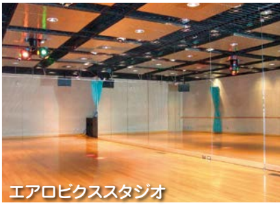
エアロビクススタジオ